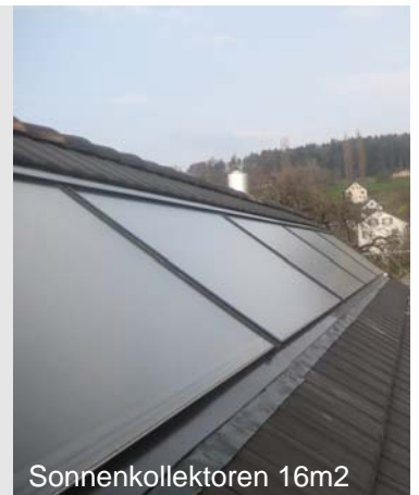
Sonnenkollektoren 16m 2