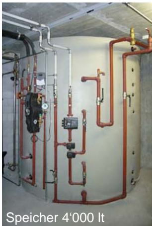
Speicher 4'000 lt