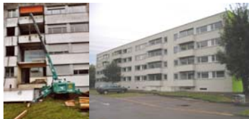
GESAMTSANIERUNG MFH ÜBERLANDSTRASSE 385+387, SCHWAMENDINGEN FÜR DAS HOCHBAUAMT DER STADT ZÜRICH (BAULEITUNG IN ARGE T. GÜNTENSPERGER + A. STREICH) 2002, 5'200'000.-