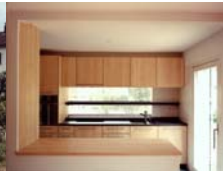
SANIERUNG REFH, GEBHARTSTRASSE 19, WINTERTHUR, (PLANUNG UND AUSFÜHRUNG) 2003-04, 230'000.-