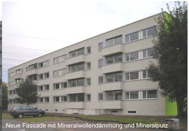
Neue Fassade mit Mineralwollendämmung und Mineralputz

In nur 6 Monaten wird eine Wohnüberbauung vollständig erneuert.