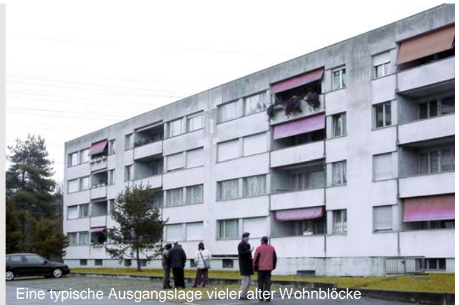
Eine typische Ausgangslage vieler alter Wohnblöcke