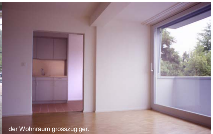
der Wohnraum grosszügiger.